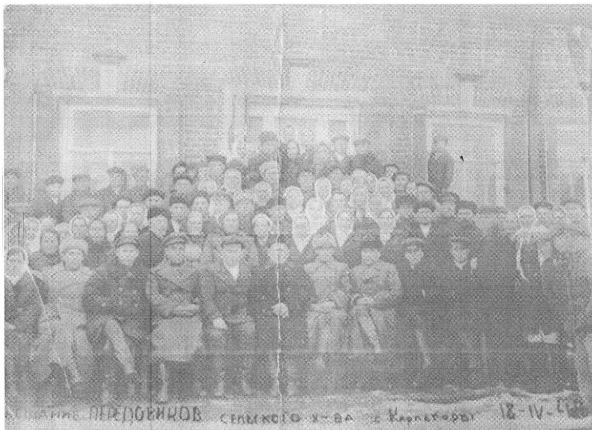
Совещание передовиков сельского хозяйства. с Карпогоры, 1948г.